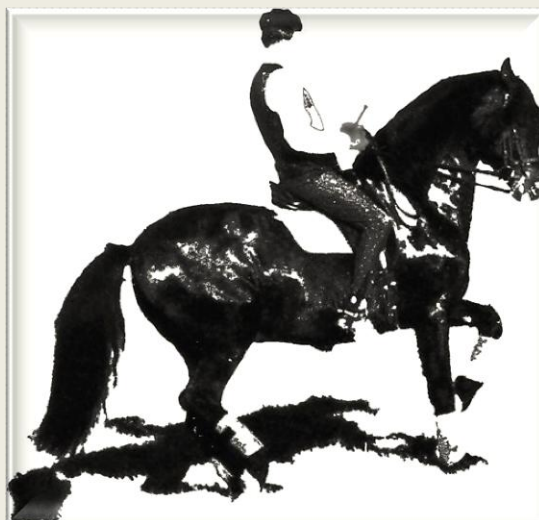
Gringo, étalon espagnol